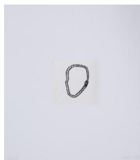
Study for a portrait, 2022