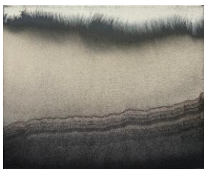
Ranta 2, 2017

muste ja akryyli kankaalle / ink and acrylic on canvas 33,5 × 28 cm