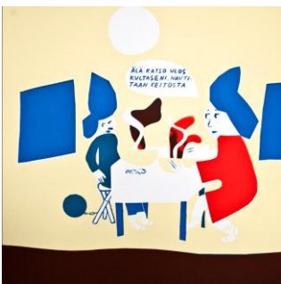
Älä katso ulos, 2020

silkscreen print 45 × 50 cm Tpl'a ed. 17/18, kehystetty / framed