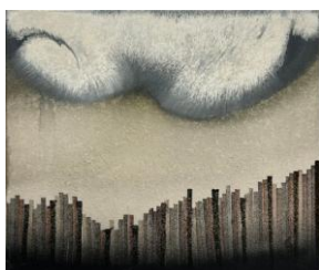
Suurkaupungin ranta, 2017

muste ja akryyli kankaalle / ink and acrylic on canvas 41 × 35 cm