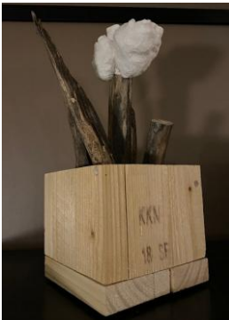
Pieni amaryllis, 2026

k./hight ~25 cm puu ja keramiikka / wood and ceramics