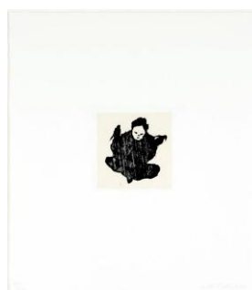
Hänen olivat linnut, 2020