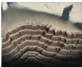
Ranta 3, 2017

muste ja akryyli kankaalle / ink and acrylic on canvas 33,5 × 28 cm