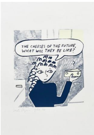
The Future Cheeses, 2022

silkscreen print 40 × 58 cm Tpl'a ed. 4/8, kehystetty / framed